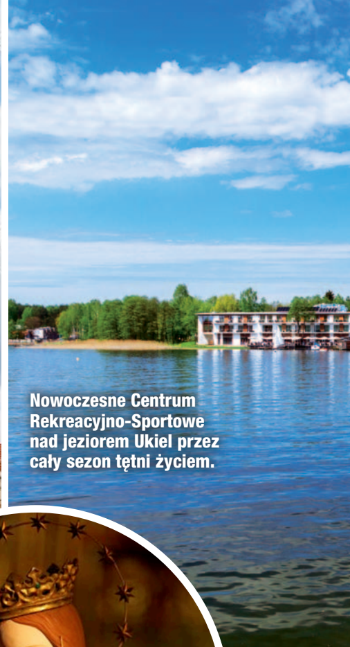
Nowoczesne Centrum Rekreacyjno-Sportowe nad jeziorem Ukiel przez cały sezon tętni życiem.