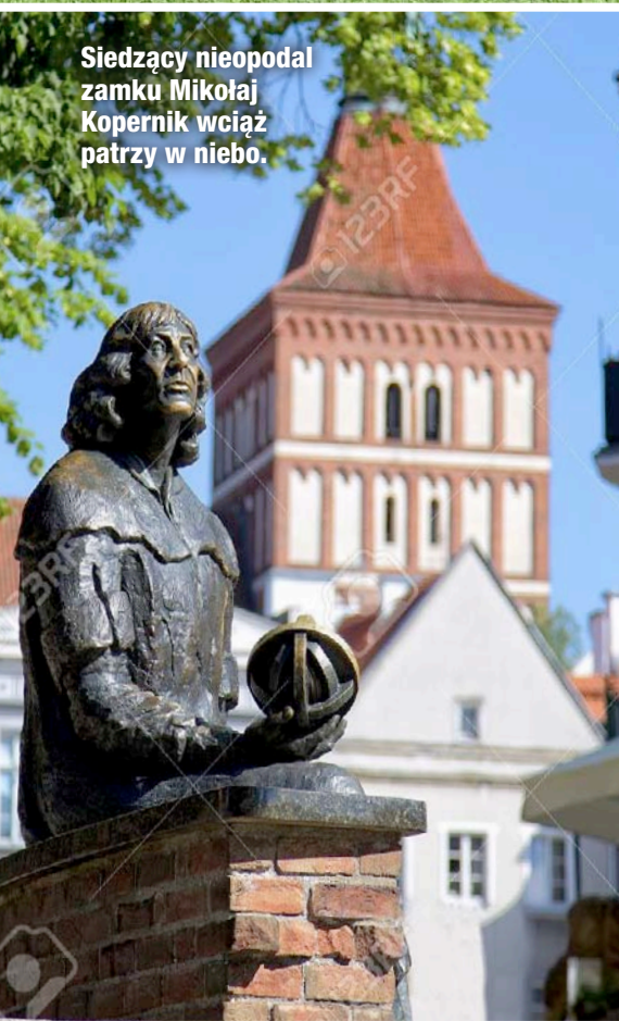
Siedzący nieopodal zamku Mikołaj Kopernik wciąż patrzy w niebo.

Czternastowieczny Zamek Kapituły Warmińskiej jest obecnie siedzibą Muzeum Warmii i Mazur.