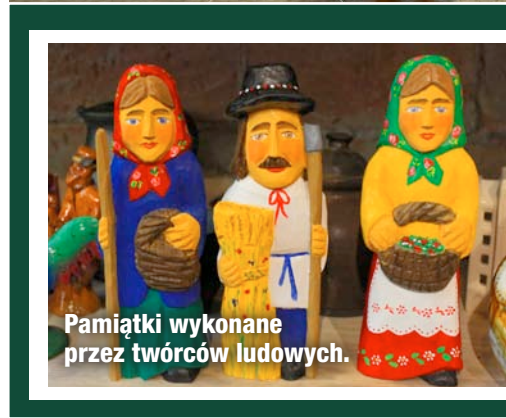
Pamiątki wykonane przez twórców ludowych.