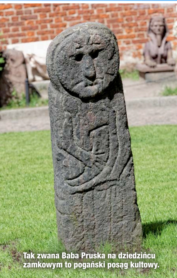
Tak zwana Baba Pruska na dziedzińcu zamkowym to pogański posąg kultowy.