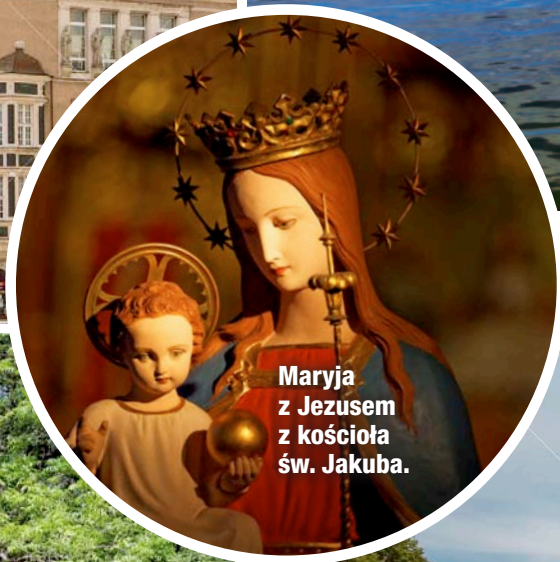
Maryja z Jezusem z kościoła św. Jakuba.