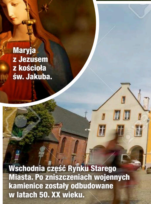
Wschodnia część Rynku Starego Miasta. Po zniszczeniach wojennych kamienice zostały odbudowane w latach 50. XX wieku.