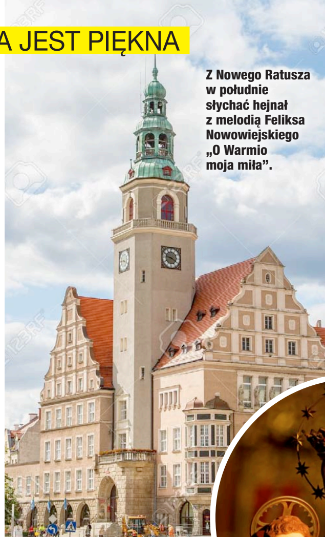
Z Nowego Ratusza w południe słychać hejnał z melodią Feliksa Nowowiejskiego „O Warmio moja miła”.