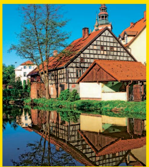
W Lidzbarku Warmińskim rzeka Łyna oddziela zamek od XIV-wiecznej Kolegiaty św. Apostołów Piotra i Pawła. Do połowy XIX wieku miasto było stolicą Warmii i jej największym miastem. Teraz spokojną atmosferą przyciąga turystów, kajakarzy i wędkarzy.