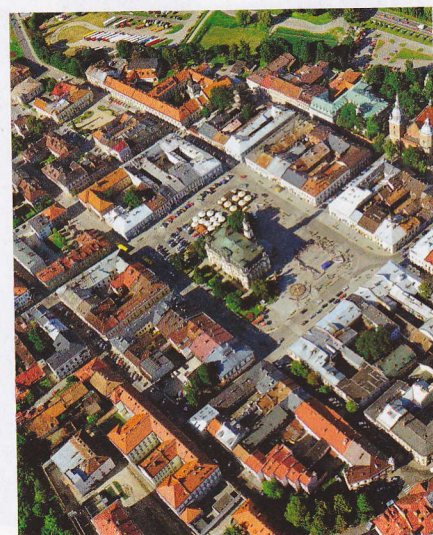
Widok z lotu ptaka na rynek w Nowym Sączu

Zwiedzenie Nowego Sącza nie zajmie dużo czasu – to plan na miłe spędzenie popołudnia. Nowosądecki rynek mierzy 150x120 metrów i po krakowskim jest największy w Małopolsce . W jego centrum znajduje się imponujący XIX-wieczny ratusz otoczony rzędem zabytkowych kamienic . Niedaleko mieści się bazylika kolegiacka św. Małgorzaty z gotyką polichromią i obrazem Przemienienia Pańskiego, a jeszcze dalej, w widłach Dunajca i Kamienicy, ruiny zamku Kazimierza Wielkiego . Dawny zakład fotograficzny, remiza i karczma to tylko część zabytków Miasteczka Galicyjskiego przy ulicy Lwowskiej – kolejnej atrakcji turystycznej Nowego Sącza. Filia Sądeckiego Parku Etnograficznego zgromadziła repliki XIX-wiecznych domów i kamienic. Przez cały rok (od października do kwietnia tylko do 14.00) można podejrzeć tu pracę zegarmistrza lub garncarza albo zajrzeć do apteki i pokoju dentystycznego. Miasteczko łączy w sobie cechy typowego skansenu i ośrodka rekreacyjno-noclegowego – w ratuszu funkcjonuje hotel, sale wystawiennicze i konferencyjne, a część małomiasteczkowej zabudowy zajmują galerie i sklepy pamiątkarskie. Niedaleko znajduje się największy skansen Małopolski – Sądecki Park Etnograficzny , gdzie na 20 hektarach zaprezentowano m.in. kulturę Lachów, Górali Sądeckich i Łemków. Tutaj też powstawał słynny „Janosik” Agnieszki Holland.