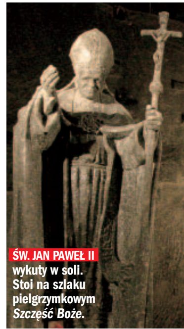
ŚW. JAN PAWEŁ II wykuty w soli. Stoi na szlaku pielgrzymkowym Szczęście Boże .

koncerty. Mikroklimatu kopalni nie da się odtworzyć na powierzchni!