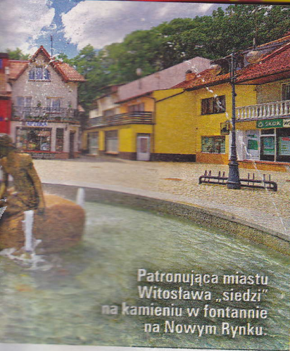
Patronująca miastu Witostawa „siedzi” na kamieniu w fontannie na Nowym Rynku.