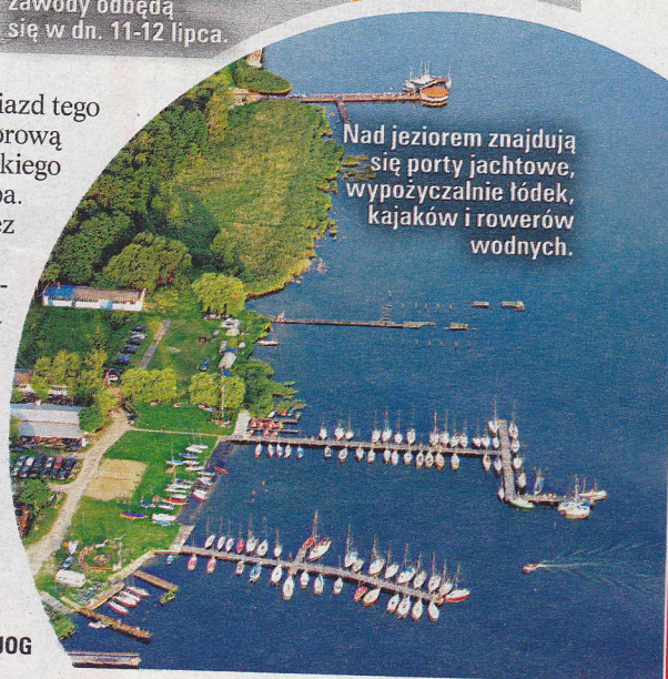
Nad jeziorem znajdują się porty jachtowe, wypożyczalnie łódek, kajaków i rowerów wodnych.