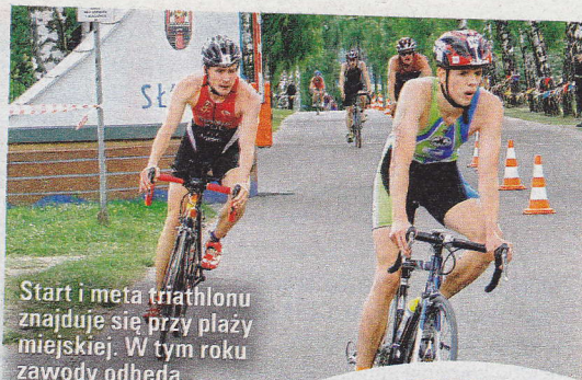
Start i meta triathlonu znajduje się przy plaży miejskiej. W tym roku zawody odbędą się w dn. 11-12 lipca.